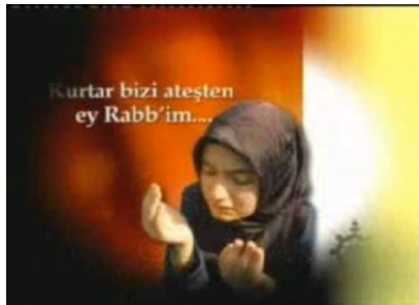
"Rette uns vor dem Feuer, oh Herr" - Ankündigung einer Sendung auf TV5

Wie bei den Zeitungen lassen sich auch bei den Fernsehsendern Unterschiede hinsichtlich ihrer politischen und weltanschaulichen Ausrichtung erkennen. Die populärsten religiös geprägten Sender sind TGRT, Kanal 7, TV 5 und Samanyolu TV. Während TGRT, Kanal 7 und Samanyolu TV dabei ein weiteres Spektrum mit wertkonservativen bis islamistischen Einstellungen bedienen, verbreiten Meltem TV, Mesaj TV, TV5 und Nur TV explizit islamistisches Gedankengut.