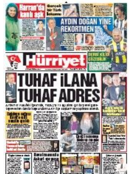
Hürriyet – die auflagenstärkste Tageszeitung in Deutschland

Die Milli Gazete (Nationale Zeitung) ist ein Sprachrohr der unter verschiedenen Namen angetretenen Parteien Necmettin Erbakans (seit 2003 ist dies die Saadet Partisi, die „Partei der Glückseligkeit“) und wird meist dem internationalen Milli-Görüş-Netzwerk zugerechnet. Das klare Bekenntnis zur Scharia und die durchgängig nationalistische und oft antisemitische, anti-westliche und anti-demokratische Grundhaltung sind wesentliche Bestandteile ihres ideologischen Rüstzeugs. Demgegenüber zeigt sich die ebenfalls islamisch geprägte Zeitung Zaman