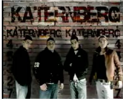
„Wo es wie im Wilden Westen ist“ – Katernerberger Straßen-Hymne

„Für viele ist nach Klasse acht Schluss, dann stehen sie draußen ohne Abschluss...“ Dass der Zusammenhang von mangelnder Bildung und Migrationshintergrund jedoch vielschichtig ist, machte eine Teilnehmerin der AG „Warum sind Ausländer an allem schuld?“ deutlich: „Fühlt ihr euch als Ausländer, obwohl ihr hier geboren seid?“ fragte sie in die Runde und fügte hinzu: „Meine Heimat ist das Ruhrgebiet.“