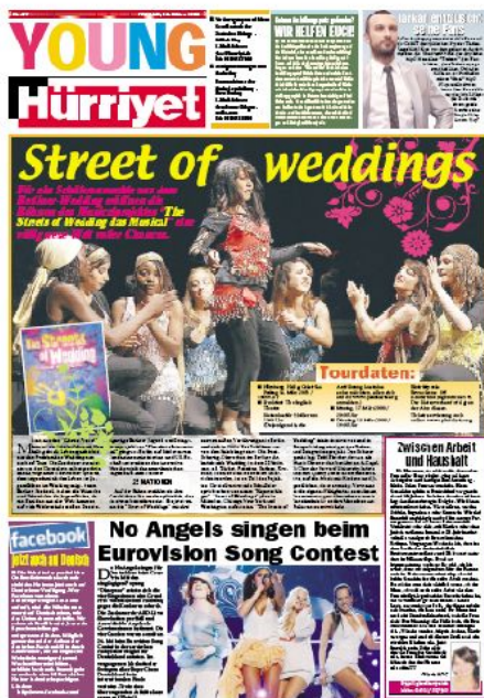
Deutschsprachige Jugendbeilage der Hürriyet

Nicht zuletzt ist es aber auch die staatliche Medienaufsichtsbehörde (RTÜK), die Normen bestimmt: Allzu freizügige Programme werden nicht selten mit tagelangen Sendeverböten belegt. Zudem kommen Stimmen, die sich jenseits des staatlich sanktionierten Mainstreams etwa zum Konflikt mit der kurdischen oder armenischen Bevölkerung äußern, immer wieder mit der Medienaufsicht in Konflikt. Und auch auf die türkischen Kanäle im Ausland versucht die Behörde Einfluss zu nehmen. So wurde u.a. auf ihr Drängen der islamistische Sender Hak-TV in Köln geschlossen.